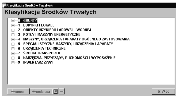
Tabela klasyfikacji środków trwałych zawiera usystematyzowany zbiór obiektów majątku trwałego i pełni jednocześnie rolę słownika grup rodzajowych wykorzystywanego w trakcie redagowania pola Grupa GUS podczas wprowadzania do ewidencji nowego środka trwałego. Zawartość tej tabeli powinna być zgodna z obowiązującymi normami. Obecnie uwzględnia ona obowiązujące akty prawne tj.: Rozporządzenie Rady Ministrów z dnia 30 grudnia 1999 r. w sprawie Klasyfikacji Środków Trwałych (KŚT)

Redagując w programie Tabelę Klasyfikacji środków trwałych można potraktować ją jako wzorzec dla wprowadzanych podziałów na grupy, podgrupy i rodzaje, stosownie do indywidualnych potrzeb przedsiębiorstwa. Ponadto w przypadku zmiany klasyfikacja rodzajowej (np. w związku z dostosowaniem do klasyfikacji europejskiej), bez żadnych trudności można zmodyfikować klasyfikację funkcjonującą w programie.